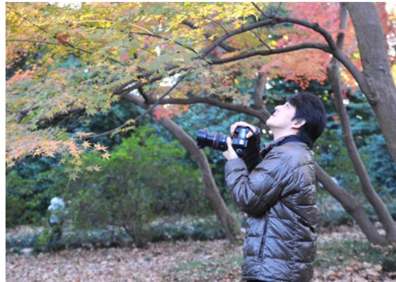
取材・文=飯島利枝子

秋野 サークルのような所属する形式の写真教室ではないので、「自分のカメラを使いこなせるようになりたい、写真の表現力を磨きたい」という方は、まずは基礎講座から試してみる感覚でご参加ください。また、2月には受講生作品展もあります。ぜひ会場にて受講生各自が自由に撮影活動を楽しんでいる様子を知っていただけたらと思います。