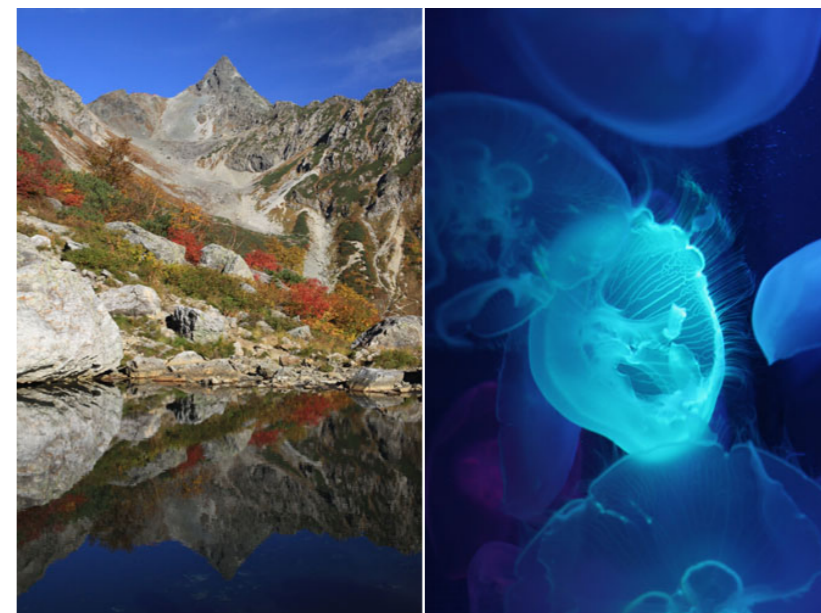
通常の私の被写体

作品決定まで残り2週間をきりました。私は最近撮ったものだけでなく、7年前からさかのぼりもう一度写真を1枚1枚見直すことにしました。今、自分の写真というものに正面から向き合っています。ほとんど上達していない自分の写真に落ち込みながらも、次はもっとこう撮ろうという具体的なアイデアも浮かんできます。こうやって自分の写真を何度も見返すことが、こんなに勉強になるなんて思ってもいませんでした。先生が言われたとおり、今、私は大いに悩んでいます。でもせつかくの機会ですから、もっともっと悩んで納得のいく作品を選びたいと思います。