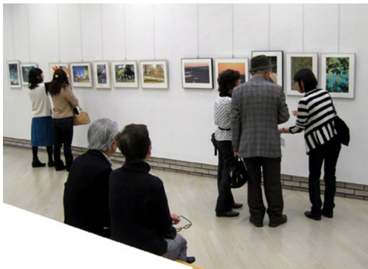
第5回(2013年)作品展の様子

出品作品、タイトル、額装は出品者各自が決定することを大切な主旨にしています。出品者が自分自身の過去の作品に時間をかけて向き合い、決断をすることがその後の撮影にとっても大切なことだとアルトフォーカスは考えているからです。そのため、出品者それぞれの関心や個性が表れた見ごたえのある展示になっています。皆様のご来場をお待ちしております。